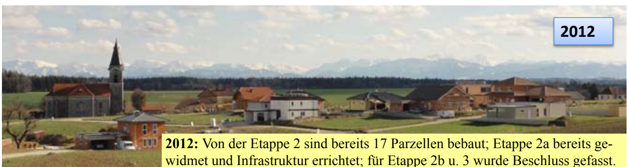
2012: Von der Etappe 2 sind bereits 17 Parzellen bebaut; Etappe 2a bereits gewidmet und Infrastruktur errichtet; für Etappe 2b u. 3 wurde Beschluss gefasst.